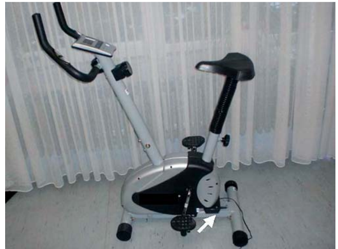
Abb. 1 Fahrrad-Heimtrainingsgerät mit integriertem Mikrokontroller. Die Trainingsdauer wird automatisch über ein GSM-Modul (Global System for Mobile Communication, weißer Pfeil) 15 Sekunden nach Beendigung des Trainings verschickt.

Die OSA-Patienten wurden gebeten, zu Hause 4 Wochen lang möglichst 30 min pro Tag zu trainieren, wobei ihnen bekannt war, dass die tägliche Zeitdauer des Trainings registriert und über Internet zum Arzt und Trainingsleiter übertragen wurde. Die durchschnittliche Trainingszeit pro Tag, während jeweils