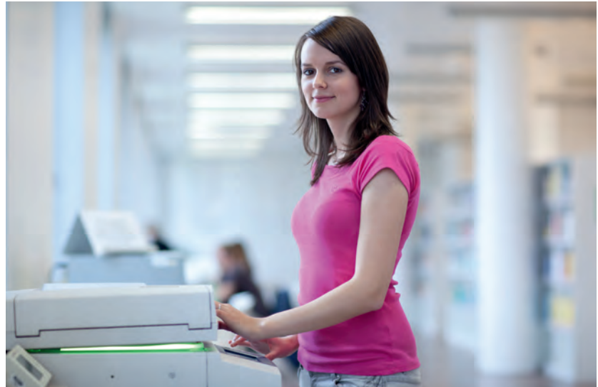
Wissenschaftliche Poster kann man in Rechenzentren von Unis oder in gut ausgestatteten Copy-Shops drucken.

DIN-A0-Ausdrucke (841x1189 mm) auf mattem 170-g-Papier oder auf Fotoglanzpapier gibt es bei Online-Druckereien bereits ab 25 Euro. Für die wetterfeste Versiegelung (Laminierung) kommen rund 20 Euro hinzu. Die Laminierung empfiehlt sich, wenn Sie das Poster mehrmals nutzen oder wenn es längere Zeit im Institut oder der therapeutischen Einrichtung hängen soll. Wie die Daten zum Drucker kommen, erfragen Sie am besten vor Ort. In der Regel können Sie sie per E-Mail oder auf CD-ROM liefern, am besten als druckfertige Datei im PDF-Format. Viele Hochschulen haben auf ihrer Website Leitlinien zur Postererstellung und Datenübermittlung veröffentlicht, zum Beispiel die Uni Lübeck unter www.itsc.uni-luebeck.de > „Dienstleistungen“ > „IT-Basisdienste“ > „Posterdruck“.