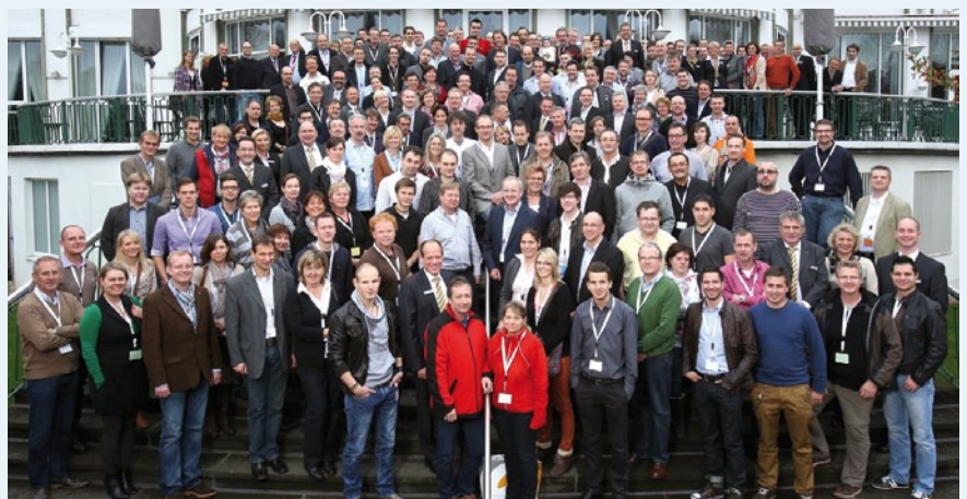
Die Teilnehmer des 5. BEGO Medical Anwendertreffens.