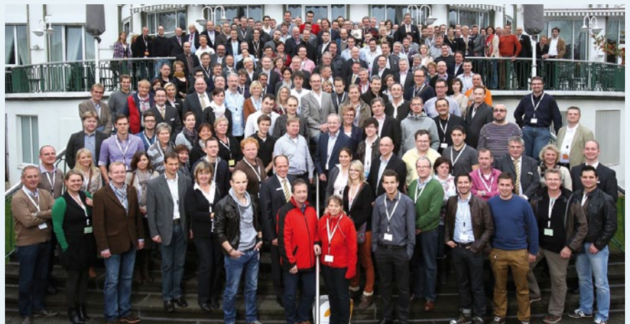
Die Teilnehmer des 5. BEGO Medical Anwendertreffens.