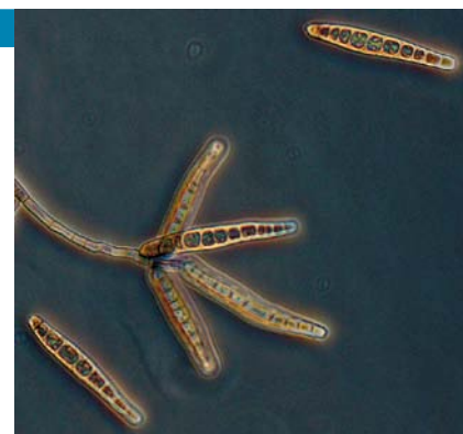
Die Schwärzepilzart Exserohilum rostratum gedeiht am besten unter warmen, feuchten Bedingungen. Sie ist im Boden und auf Pflanzen, insbesondere Gräsern, weit verbreitet. Sie verursacht nur selten humane Erkrankungen. Meist handelt es sich dann um subkutane Läsionen.

Ende September hatte die Herstellerfirma NECC zunächst 3 Chargen des Medikaments zurückgerufen. Mittlerweile hatten jedoch bereits fast 14000 Menschen in 23 Bundesstaaten mindestens eine der Spritzen erhalten. Anfang Oktober wurde der Rückruf dann auf alle Produkte ausgeweitet, die von dem NECC-Standort in Framingham (Massachusetts) vertrieben worden waren. Bei den folgenden Untersuchungen konnte in den zuerst betroffenen Chargen E. rostratum nachgewiesen werden. Außerdem wurden auch die Pilz-