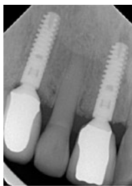
Abb. 6 Röntgenkontrolle nach Eingliederung der Keramikkrone.