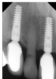
Abb. 7 Röntgenologisch stabile Knochenverhältnisse 10 Jahre nach Implantation.