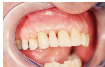
Abb. 5 Die Keramikkrone in situ.