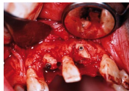
Abb. 3 Fixierung der Knochenblöcke mit Osteosyntheseschrauben.