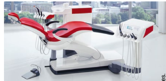
Die Behandlungseinheit SINIUS unterstützt den Zahnarzt dabei, seine eigene Gesundheit bei jeder Behandlung zu schonen.

Meine Wahl fiel auf die Behandlungseinheit SINIUS von Sirona. Sie unterstützt mich und mein Team darin, die Prinzipien für ergonomisches Arbeiten einzuhalten. Grundgedanke des Ergonomiekonzepts ist, dass das Arbeitsfeld für den Zahnarzt optimal positioniert wird. Mithilfe der elektronisch steuerbaren Kopfstütze lässt sich der Patientenkopf leichter und präziser lagern, als wenn man dies manuell einstellen müsste. Die Stellung der Kopfstütze und alle anderen Parameter des Behandlungsstuhls lassen sich bei SINIUS für jeden Behandler individuell einprogrammieren, ähnlich wie bei einem Auto, das automatisch den Sitz und die Spiegel auf den jeweiligen Fahrer anpasst. Diese Voreinstellungen nimmt man am intuitiv bedienbaren Touchscreen EasyTouch vor