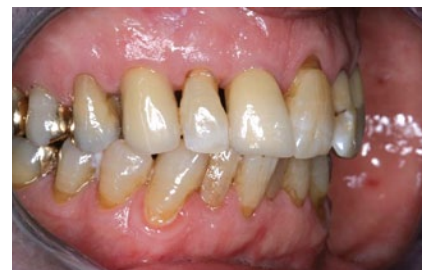
Abb. 8 Klinisch reizfreies Weichgewebe.