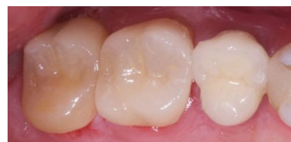
Abb. 3 Endsituation direkt nach Einsetzen und Entfernen des Kofferdams – das Zahnfleisch ist noch etwas gerötet.

des Autors immer öfter eine Ausweitung des Einsatzgebiets. So wurde auch hier für die Gerüsterstellung die CAD/CAM-Technik gewählt. Software-seitig liegen die Vorteile in einer mikrometergenauen Zahnarzt- oder indikationsindividuellen Vorwahl der Zement- oder Klebefuge sowie einem Designvorschlag für die Rehabilitation.