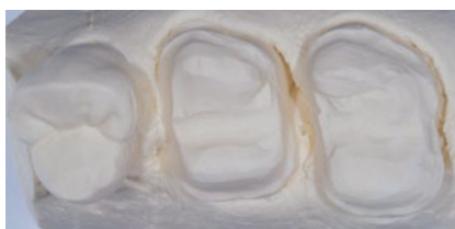
Abb. 1 Die Ausgangssituation, wie sie sich auf dem Modell darstellt.

Nach der Vorbereitung des Meistermodells erfolgte ein Scan der Stümpfe 26 und 27 mit einem Desktop-Scanner (3Shape, Kopenhagen) (Abb. 1). Nach einem Design-Check am Bildschirm wurden die Daten an das laboreigene