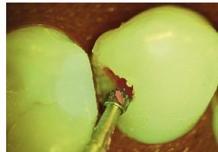
Abb. 3 Während der Exkavation.