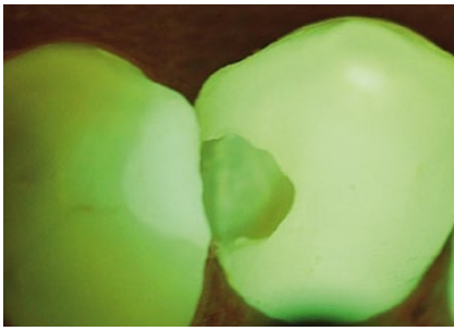
Abb. 4 Nach der Exkavation.