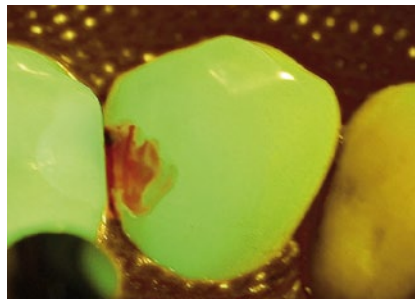
Abb. 2 Nach Eröffnung der kariösen Läsion.