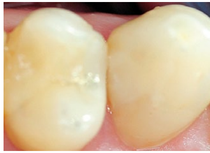
Abb. 5 Nach der Restauration.

Ich kenne und nutze die FACE®-Technologie seit gut 1 Jahr zur Kariesdetektion und konnte bereits mit den ersten Prototypen des neuen Detektionssystems arbeiten. Während der Entwicklungsphase führten die Produktentwickler des Herstellers intensive Gespräche mit erfahrenen Erprobern. Unsere Hinweise wurden konstruktiv aufgenommen und umgesetzt.