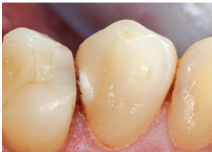
Abb. 1 Ausgangssituation.

Ein weiterer Vorteil des Detektionssystems, der mir im Praxiseinsatz aufgefallen ist, liegt in der intensiveren Einbindung meiner Teammitglieder. Meine Assistentin beispielsweise, die während der Behandlung das Gerät in den Mundraum hält, trägt ebenfalls die spezielle Filterbrille, mit der man die roten kariösen von den grünen nicht kariösen Bereichen unterscheiden kann, sodass auch sie die Fluoreszenz gut erkennt. So kann sie mir gezielte Hinweise geben, da sie aus einer 2. Perspektive zusätzliche, eventuell versteckte kariöse Läsionen entdeckt – etwa in Unterschnitten – die sonst vielleicht verborgen geblieben wären. Das zeigt, wie wichtig die Zusammenarbeit zwischen Zahnarzt und Assistenz ist. Es verwundert also nicht, dass das neue Gerät auch bei meinen Assistentinnen gut ankommt.