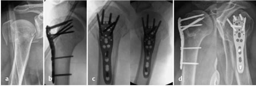
Abb. 2 Valgisch dislozierte 4-Part-Humeruskopffraktur eines 72-jährigen Patienten und konsekutive plattenosteosynthetische Versorgung mittels Philos®-Platte. a zeigt die präoperative Situation, b das intraoperative Ergebnis, c das Ergebnis am 2. postoperativen Tag und d das Ergebnis 1 Jahr nach erfolgter Versorgung.

Eine weitere Indikationsgruppe bilden kindliche proximale Humerusfrakturen.