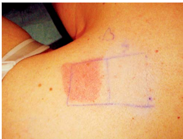
Abb. 2 Negative Reaktion 30 Minuten nach Fotoprovokation mit 0,05\text{ J/cm}^2 UVB 4 Stunden nach Einnahme von 40 mg Cetirizin und topischer Anwendung von Daylong® extreme SPF 50+ liposomale Sonnenschutz-Lotion (rechts). Erythematöse Reaktion bei topischer Anwendung des Sunblockers Ambre Solaire delial UVSensitiv 50+ Sonnenmilch (links).

Unter einer vorherigen morgendlichen Gabe von 30–40 mg Cetirizin bzw. einer Kombination von 10 mg Cetirizin, 10 mg Loratadin, 120 mg Fexofenadin und 10 mg Montelukast fand sich 4 Stunden später in der Provokationstestung mit 0,50\text{ J/cm}^2 UVB und 10\text{ J/cm}^2 UVA1 jeweils ein scharf begrenztes Erythem ohne Quaddelbildung. Nur bei vorheriger topischer Applikation der liposomalen Sonnenschutzlotion Daylong® extreme SPF 50+ (Spirig Pharma AG), nicht dagegen bei Ambre Solaire delial UV-Sensitiv SPF 50+ Sonnenmilch (Garnier) gelang es, auch diese Erythembildung komplett zu verhindern (▶ Abb. 2 und ▶ Abb. 3 ). Unter einer Kombination von 10 mg Cetirizin, 10 mg Loratadin, 120 mg Fexofenadin und 10 mg Montelukast und topischer Anwendung von Daylong® extreme SPF 50+ konnte die Patientin sich ca. 30 Minuten beschwerdefrei der natürlichen Sonne aussetzen, während nicht mit Sonnenschutz behandelte Areale Erythembildung zeigten. Das Schema mit Cetirizin in vierfacher Dosierung empfand die Patientin als deutlich mehr müde machend im Vergleich zu der Kombination von drei Antihistaminika und dem Leukotrien-Rezeptorantagonisten Montelukast in jeweils üblicher Dosierung.