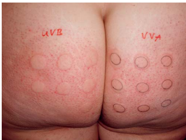
Abb. 1 Urtikarielle Reaktion 30 Minuten nach Bestrahlung mit UVB und UVA1: minimale Urtikaria auslösende Dosis (MUD) 0,025\text{ J/cm}^2 für UVB und 0,5\text{ J/cm}^2 für UVA1. Diagnose: Licht-Urtikaria.