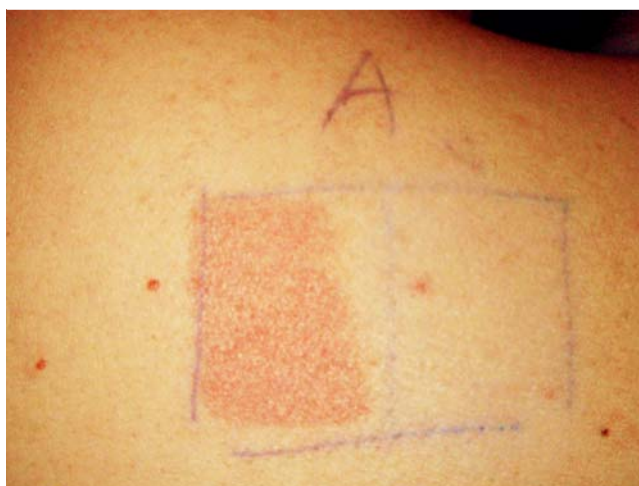
Abb. 3 Negative Reaktion 30 Minuten nach Fotoprovokation mit 10\text{ J/cm}^2 UVA1 4 Stunden nach Einnahme von 40 mg Cetirizin und topischer Anwendung von Daylong® extreme SPF 50+ liposomale Sonnenschutz-Lotion (rechts). Erythematöse Reaktion bei topischer Anwendung des Sunblockers Ambre Solaire delial UVSensitiv 50+ Sonnenmilch (links).