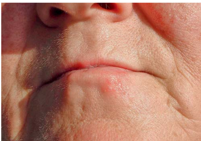
Abb. 3 Befund nach vierwöchiger Therapie mit Pimecrolimus: Minderung des Erythems und Abflachung der Herde.

Über diverse Komorbiditäten beim AERZG wurde kasuistisch berichtet. Hierzu zählen neben der Arteriitis temporalis [9], der Vitiligo [10] und dem Diabetes mellitus [11] maligne Erkrankungen [12,13]. Auffällig ist das häufigere Auftreten von Lymphomen, sowohl der B-Zell- als auch der T-Zell-Reihe [14]. Wir führten daher orientierende Untersuchungen zum Ausschluss eines malignen Lymphoms ohne wesentlichen pathologischen Befund durch. Bemerkenswert in unserem Fall ist, dass das aktinische Granulom sich im unmittelbaren Anschluss an einen ausgeprägten Herpes simplex labialis entwickelte. Beschrieben wurde das unabhängige gleichzeitige Auftreten mit einem riesenhaften Molluscum contagiosum bei einer erwachsenen HIV-negativen Patientin [6]. Die Induktion von Granuloma-annulare-Herden am Orte stattgehabter Herpes-Virus-Infektionen wurde öfter beschrieben (Wolf's isotopische Reaktion) [15,16], zum Teil auch bei Patienten mit begleitender hämatologischer Erkrankung [17, 18].