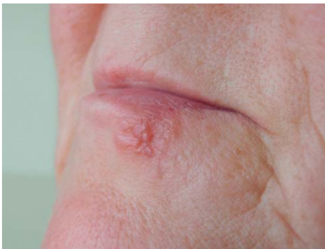
Abb. 1 Anulär betonter papulöser Herd eines postherpetischen aktinischen Granuloms O'Brien an der Unterlippe bei 56-jähriger Patientin.