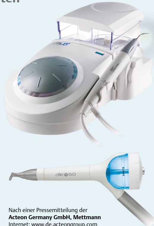
Nach einer Pressemitteilung der Acteon Germany GmbH, Mettmann Internet: www.de.acteongroup.com

Die AIR-N-GO-Service- und Garantie-Offensive geht weiter: Nach Gratis-Testgeräten und Pulverproben für interessierte Zahnärzte, kostenlosen Austauschteilen und attraktiven Paketangeboten mit der derzeit größten Pulvervielfalt auf dem Markt gibt es vom 1. Juli 2012 an ein erweitertes Servicepaket: So bietet die Acteon Group beim Kauf von AIR-N-GO, allen Satelec-Scalern und Ultraschall-Geräten einen Austausch- bzw. Reparaturservice innerhalb von 48h sowie eine 2-Jahre-Systemgarantie (ohne Instrumente und Verbrauchsmaterialien). Auch eine zusätzliche Garantieverlängerung für nochmals 2 Jahre ist gegen einen geringen Aufpreis möglich. Neben dem neuen Garantie- und Servicepaket hält die Firma für alle AIR-N-GO-Anwender ab sofort auch diverse Aufklärungs- und Informationsmaterialien bereit wie eine Patientenbroschüre und eine kompakte Pflege- und Quickstart-Anleitung.