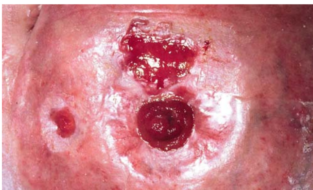
Abb. 3 Extraintestinaler Morbus Crohn.

ergaben einen Nachweis von vereinzelt Staphylococcus aureus sowie nur in Anreicherung Streptococcus agalactiae . In der Sonografie des Oberbauches zeigte sich ein unkomplizierter Gallenblasenstein, das Routinelabor war bis auf eine leichte Transaminasenerhöhung und Leukozytose unauffällig. In der aus dem Ulkusrand des größeren Ulkus entnommenen Histologie zeigten sich epitheloidzellige Granulome ohne nachweisbare Fremdkörper. Für eine Psoriasis bestand histologisch kein Anhalt. Wir stellten daher die Diagnose einer kutanen Manifestation des Morbus Crohn. Die histologisch auch infrage kommende Differenzialdiagnose von Fremdkörper-induzierten Granulomen hielten wir aufgrund der Entfernung der Ulzera vom Stoma (hier kein Nahtmaterial zu vermuten) für unwahrscheinlich. Wir leiteten eine Therapie mit Cyclosporin A (2 mg/kg KG) ein. Lokal wurde mit Hydrokolloid-Wundauflagen behandelt. Unter dieser Therapie heilten die Ulzera innerhalb von 5 Monaten ab.