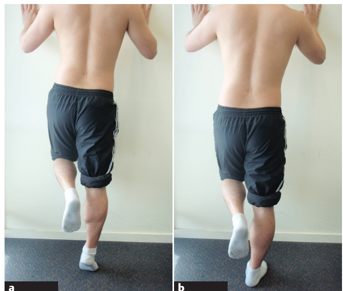
Abb. 1a u. b Drop-Test für das rechte SIG. a Der Patient hebt beide Fersen vom Boden ab und übernimmt das Körpergewicht fast komplett auf das rechte Bein. b Dann lässt er die Ferse ruckartig auf den Boden zurückfallen. Dabei bleibt das rechte Kniegelenk extended. Der Test bewirkt eine kranial gerichtete Scherkräft im rechten SIG.