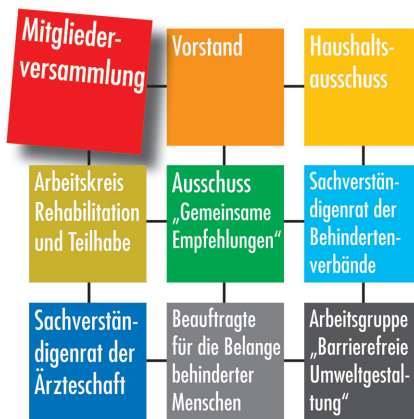
Abb. 3 Die Gremien der BAR.

beratender Stimme an den Sitzungen des Vorstandes der BAR teil.