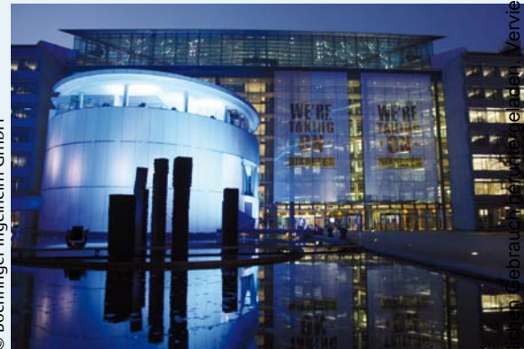
Das Headquarter von Boehringer Ingelheim in Ingelheim am Rhein wurde anlässlich des Weltdiabetestags blau erleuchtet.

die Bedeutung einer gesunden Ernährung und einer aktiven Lebensweise bei der Vermeidung von Typ-2-Diabetes bzw. im Umgang mit der Krankheit zu unterstreichen, standen in der Aktionswoche aber auch eine Vielzahl weiterer Aktivitäten auf dem Programm.