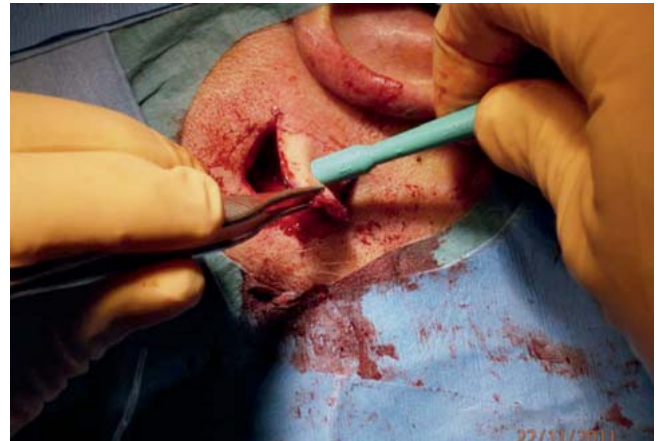
Abb. 9 Biopsiestanze.