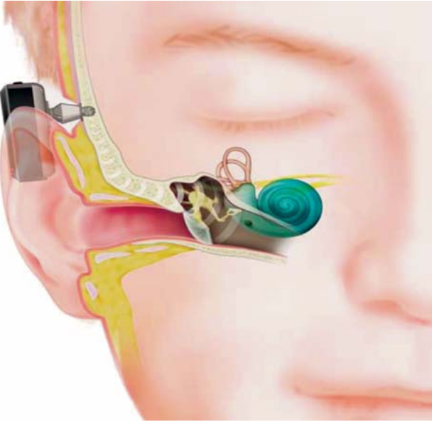
Abb. 1 BAHA-Implantat.