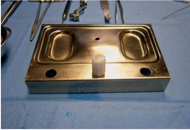
Abb. 6 Instrumententablett mit Implantat in einer Kunststoffampulle.