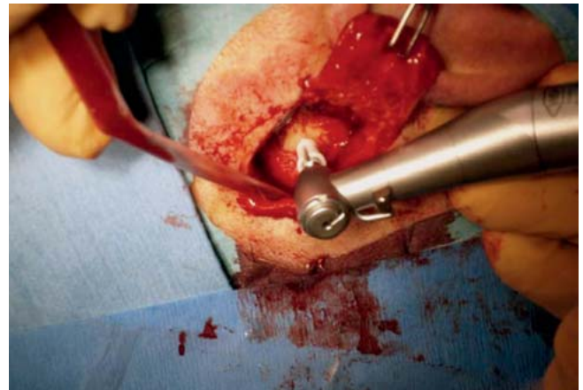
Abb. 3 Führungsbohrer 3 mm mit Distanzstück (Plastikhülse).