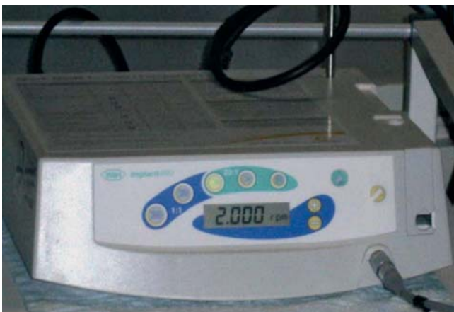
Abb. 4 Bohrer auf 2000 U/min.