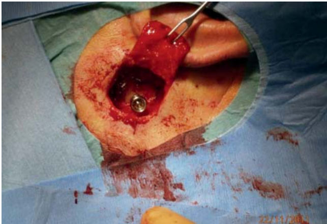
Abb. 8 Implantat im Knochen.