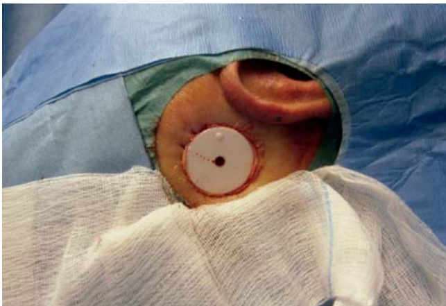
Abb. 10 Heilungskäppchen mit Vaselinetamponade.