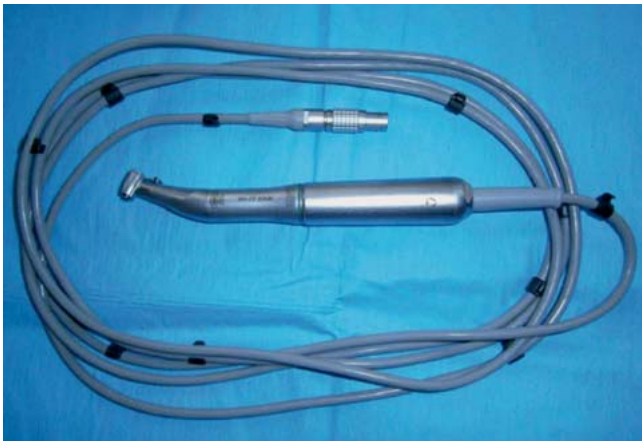
Abb. 2 Bohrer.

Der Versenkbohrer verfügt über einen Anschlag, damit man rechtzeitig er- kennt, wann die Versenkbohrung abge- schlossen ist. Das Implantat wird nun eingedreht, dieses hat ein selbstschnei- dendes Gewinde. Hier stellt man am Bohrer die Drehmomenteinstellung auf 40–50 Ncm. Das Implantat, das sich in einer Kunststoffampulle befindet, wird auf ein Instrumententablett gestellt ( Abb. 6 ).