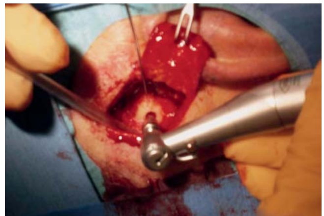
Abb. 5 Versenkbohrer.