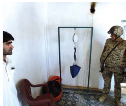
Abb. 1 und 2 Medizinische Versorgung durch engagierte Pflegekräfte und Ärzte in Health Posts in der Umgebung von Kunduz, Afghanistan.