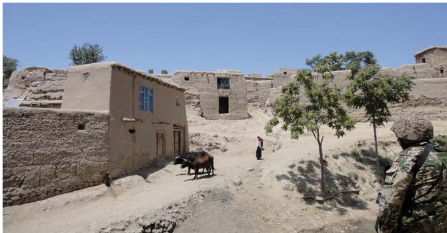
Abb. 3 Schwierige infrastrukturelle und klimatische Bedingungen für eine Grundversorgung.