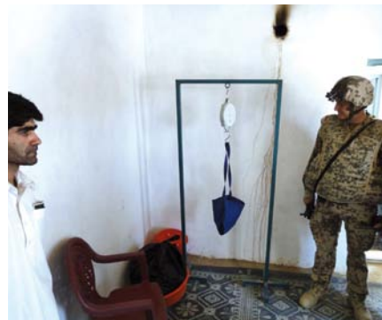
Abb. 1 und 2 Medizinische Versorgung durch engagierte Pflegekräfte und Ärzte in Health Posts in der Umgebung von Kunduz, Afghanistan.