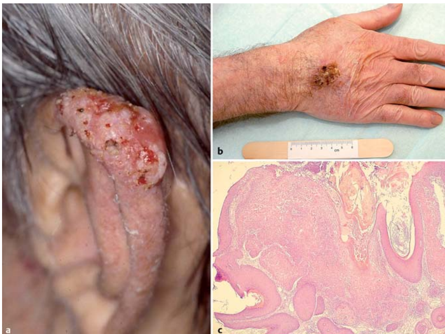
Abb. 2 a, b Plattenepithelkarzinome; c Histologie: ulzerierendes und die Dermis infiltrierendes Karzinom mit schlecht differenzierten Keratinozyten; HE, 80 ×.

Die Therapieoptionen von Plattenepithelkarzinomen der Haut, aber auch von Basalzellkarzinomen ist in den AWMF-Leitlinien (AWMF: Arbeitsgemeinschaft der Wissenschaftlichen Medizini-