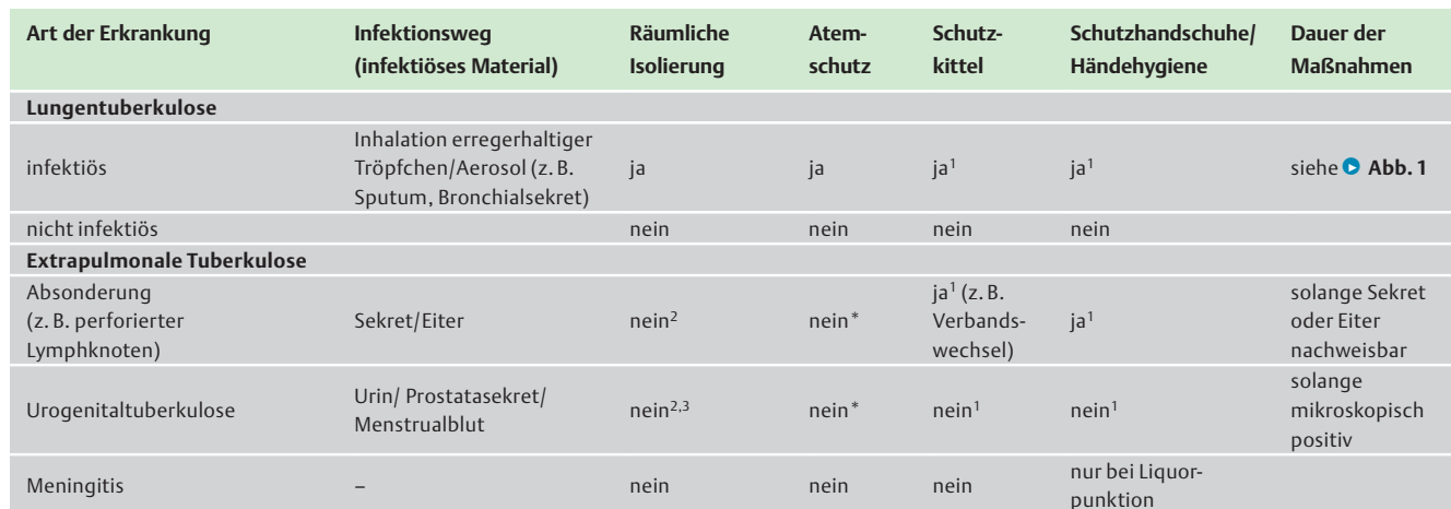
Tab. 3 Maßnahmen zur Prävention der Tuberkuloseübertragung.

1 nur notwendig bei (erwartetem) Kontakt mit erregerehaltigem Material.