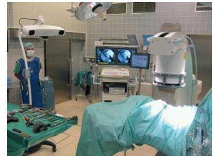
Abb. 4 Die Beckenreferenzierung erfolgt mit einer durch die den Patienten komplett umfassende Abdeckung hindurch montierten Referenzklemme. Nach dem Scan wird die Abdeckung entfernt und dabei die Klemme belassen. Der 3-D-C-Arm berührt nicht das OP-Feld beim Scan und wird nach dem Scan wieder steril bezogen.

In der computerassistierten Beckenchirurgie hat sich vornehmlich die navigationsgestützte SI-Verschraubung bewährt. Sie wird zumeist als perkutane Schraubenosteosynthese bei wenig dislozierten Sakrumfrakturen oder SI-Gelenksprengungen durchgeführt, die geschlossen reponiert werden können [2–4, 7, 10, 12]. Aber auch bei Acetabulumfrakturen werden bei geeigneter Frakturform und möglicher geschlossener Reposition zunehmend perkutane Schraubenosteosynthesen durchgeführt [5, 6]. Aufgrund der komplexen Beckengeometrie sind sie technisch anspruchsvoll. Durch die Navigation kann die räumliche Kontrolle der Schraubenplatzierungen verbessert werden mit dem Ziel, die beim konventionellen Vorgehen häufig erforderlichen hohen Röntgendurchleuchtungszeiten zu reduzieren [8, 10, 11] und die Präzision zu erhöhen.