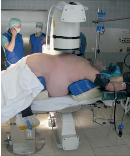
Abb. 2 Aufgrund der Adipositas kann der Bildwandler Siemens Arcadis Orbic 3D nicht um das zentral zu lagernde OP-Gebiet rotieren, es ist kein 3-D-Scan möglich. Alternativen wären die 2-D-Navigation mit eingeschränkter Bildqualität oder die CT-basierte Navigation mit erschwertem Matching.

Bei noch begrenzten 3-D-Datenvolumina (Siemens Arcadis Orbic 3D ca. je 12,5 cm Kantenlänge) lässt sich in diesem Volumen jedoch in frei zu wählenden Schnittebenen die aktuelle Instrumentenposition simultan darstellen. Analog der Darstellung in einem CT-Datensatz kann man die optimale Implantatposition planen und abspeichern, um sich daran während des Operierens zu orientieren ( Abb. 3 ).