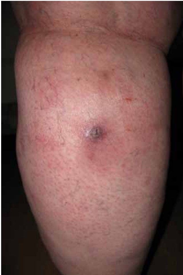
Abb. 1 Ansicht der linken Wade von dorsal mit diffuser Rötung und schmerzhafter zentraler Induration.

Die superfizielle venöse Thrombophlebitis (SVT) ist durch Schmerzen, Verhärtung und/oder Rötung einer oberflächlich verlaufenden Vene gekennzeichnet und wird durch eine Entzündung, Infektion und/oder Thrombose derselben hervorgerufen. Die SVT ist im klinischen Alltag mit einer Inzidenz von etwa 1:800–1000 Einwohner/Jahr relativ häufig (Cesarone MR et al. Angiology 2007; 58: 7S–14S). Gemeinhin wurde für die SVT eine gute Prognose angenommen, aber neuere Daten zeigen auf, dass Embolien, die von einer die SVT begleitenden tiefen Venenthrombose ausgehen, häufig sind und/oder dass das Risiko für das Auftreten einer tiefen Venenthrombose oder Lungenembolie in den Folgemonaten erhöht ist (van Weer H et al. Fam Pract. 2006; 55: 52–57; Decousus H et al. Ann Intern Med 2010; 152: 218–224). Wir berichten über einen Verdachtsfall einer SVT und deren schwierige Differenzialdiagnose.