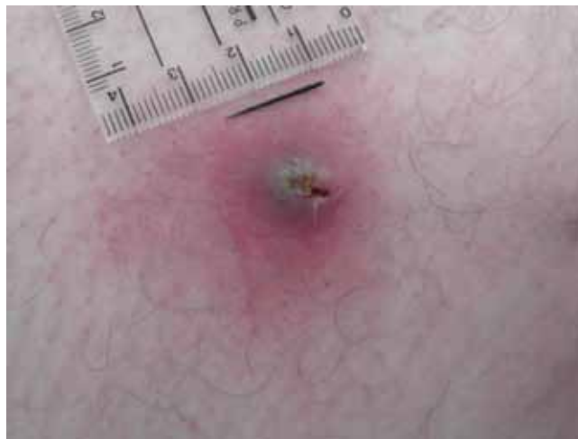
Abb. 3 Ein Teil der Nähnadel nach chirurgischer Exploration.

before onset of symptoms. Low molecular heparin was stopped and after surgical removal of the needle fragments, complete remission of symptoms occurred within three weeks.