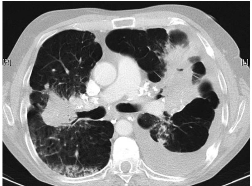
Abb. 4 Zeichen der irreversiblen parenchymatösen Destruktion mit peripherer Überblähung, zentraler Ballung der hilären Lymphadenopathie und Verkalkung mediastinaler Lymphknoten im Stadium IV. Histologisch wurde eine Tuberkulose ausgeschlossen, Verkalkungen der thorakalen Lymphknoten finden sich in einem Teil der chronisch-aktiven Verlaufsform der Sarkoidose.

Mithilfe der flexiblen fiberoptischen Bronchoskopie können transbronchiale Lungenbiopsien (TBLB) entnommen werden. Die Trefferquote