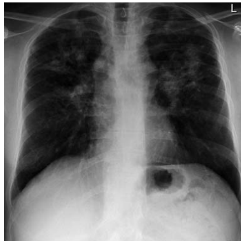
Abb. 5 Radiologisches Muster einer Sarkoidose im Stadium II–III. In dem Fall einer chronisch-aktiven Verlaufsform sind sowohl Anamnese, Funktionsdiagnostik als auch Schnittbildgebung notwendig, um eine immunsuppressive Therapie mit der geringen Variabilität der Thoraxaufnahme über einen längeren Zeitraum (> 6 Monate) zu korrelieren.

eines Materialgewinns bei diesem Verfahren liegt zwischen 40 und 90% [116, 117]. Die transbronchiale Nadelaspiration (TBNA) eignet sich zur Biopsiegewinnung bei einer intrathorakalen Lymphadenopathie. Durch Einsatz des endobronchialen Ultraschalls (EBUS) kann die Quote repräsentativer Biopsien weiter gesteigert werden [118–121].