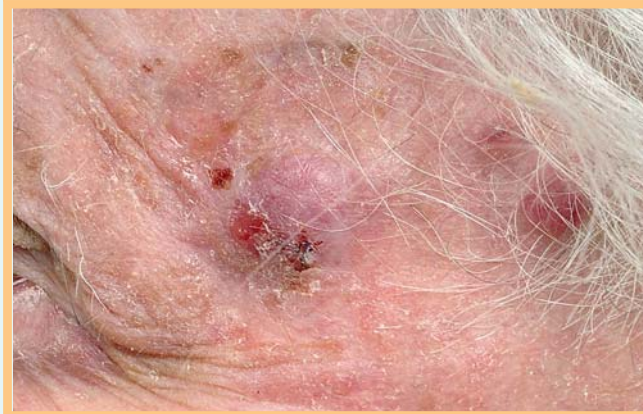
Abb. 1 Livid-rote, fokale erosive Knoten an der linken Schläfe.