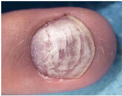
Abb. 2 Oberflächliche Nagelpilzinfektion.

stumpfen Skalpell oder scharfem Löffel) herausgelöst. Beim oberflächlichen Typ (☉ Abb. 2 ) sind Nagelspäne von der Nageloberfläche zu gewinnen.