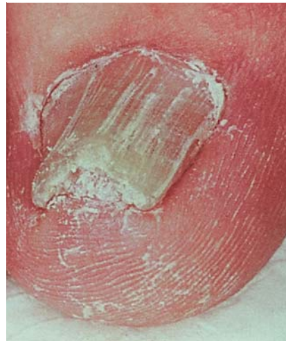
Abb. 1 Subunguale Nagelpilzinfektion.

Die dimorphen Pilze wachsen bei 22–28 °C in ihrer saprophytären, myzelbildenden Phase und vermögen bei 37 °C in die parasitäre Hefephase überzugehen, wobei sich die Morphologie entsprechend ändert und Sprosszellen an Stelle der ursprünglichen, zahlreichen, charakteristischen Myzelstrukturen gebildet werden. Der Dimorphismus ist ein charakteristisches Merkmal einiger Pilzerreger systemischer Mykosen, wie z. B. der Sporothrix- und Histoplasma-Mykose sowie der nordamerikanischen Blastomykose.