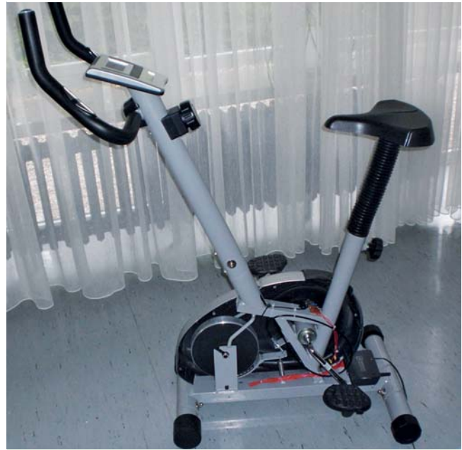
Abb. 2 Fahrradergometer nach Entfernung der Abdeckung. Man sieht zwei Schwungscheiben. An der hinteren Scheibe befindet sich ein Magnet, der in einem Magnetschalter bei Pedalbewegungen einen Impuls auslöst. Am hinteren Ende befindet sich ein GSM-Modul (Global System for Mobile Communication) mit eingebautem Microcontroller, in dem die Zeitdauer des Trainings automatisch erfasst wird. Etwa 30 sec nach Beendigung des Trainings wird die Trainingsdauer über die Antenne automatisch verschickt. Die Stromversorgung erfolgt über Trafo und Netzkabel.

Die gleiche Technik wurde zwischenzeitlich auf ein Fahrradergometer übertragen (siehe Abb. 2 ). Die Trainingszeiten können vom Trainingsleiter aus einem Diagramm, das jeweils einen Monat umfasst, abgelesen werden ( Abb. 3 ).