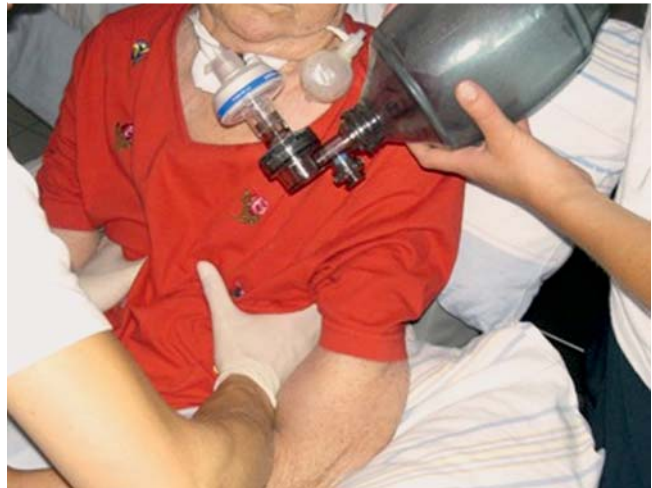
Abb. 1 Manuelle Hustenunterstützung an der unteren Thoraxapertur mit Druck nach medial und cranial. Das Sekret wird so unterstützend kanülenwärts transportiert.

Während bei nicht-tracheotomierten Patienten die Insufflationen über eine Beatmungsmaske gegeben werden, erfolgt das Bagging bei tracheotomierten Patienten durch Ansetzen des Beatmungsbeckens auf das Kanülenende (vgl. Abb. 2 ). Es empfiehlt sich die Verwendung eines Bakterienfilters. Die Anwendung ist im Folgenden bei beiden Patientengruppen gleich. Selbst wenn es trotz der manuellen Hustenunterstützung nicht zum Sekrettransport aus der Trachealkanüle kommt, reicht sie doch häufig aus, um das Sekret in den Schaft der Trachealkanüle zu transportieren, so dass der Patient lediglich innerhalb der Kanüle abgesaugt werden muss. Dies bedeutet einen erheblich verminderten Reiz und eine Minimierung der Schleimhautverletzungen an der Trachea. Bei Patienten mit einer geblockten Trachealkanüle ist die Möglichkeit des Luftanhaltens als Steigerungsoption jedoch nicht gegeben, da kein subglottischer Druck aufgebaut werden kann. Hier kann durch Verwendung eines Einwegventils zwischen Bakterienfilter und Beatmungsbeutel ein passiver tracheobronchialer Staudruck erzielt werden.