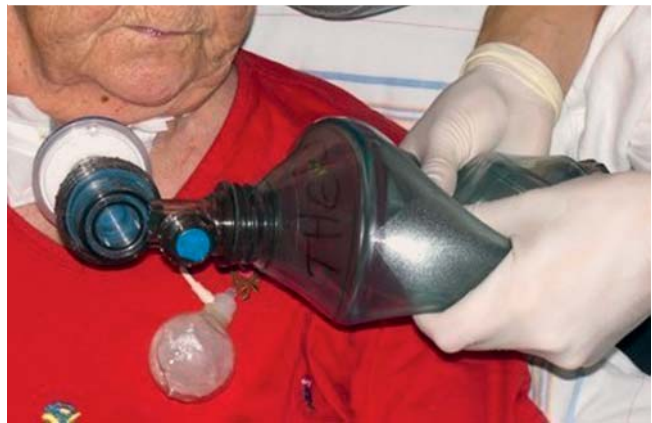
Abb. 2 Bagging: Unterstützung der Inspiration durch manuelle Hyperinsufflation mit Hilfe eines Beatmungsbeckens bei einer Patientin mit geblockter Trachealkanüle.