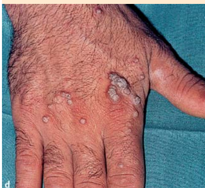
d Warzen am Handrücken rechts (Verrucae vulgares).

neue Szene eingeblendet und solche Szenenfolgen erfüllen unser Leben. Entweder wird der Blick in Szenenfolgen über ein umfangreiches Bild geführt oder es wechselt die Bilderfolge vor unseren Augen. Der Zeitrahmen einer Blickdiagnose ist also abgesteckt zwischen 1/20 und 3 s. Ebenso kann man die Größe der auf einen Blick zu erfassenden Fläche mit dem zentralen Sehen eingrenzen, die etwa einem umrandeten Gesicht entspricht im Abstand von wenigen Metern, was die exakte Erfassung der Einzelheiten ermöglicht. So ist die „Blickdiagnose“ zeitlich und räumlich einzugrenzen auf max. 3 s und eine Rundfläche von gut 50 cm Durchmesser.