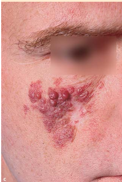
c Feuermal an der Wange rechts (Naevus flammeus).