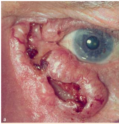
Abb. 3 Klassische Blickdiagnosen. Die typische Morphologie einer umschriebenen und markanten Hautveränderung wird auf einen Blick erfasst und kann unmittelbar in die Anatomie des einsehbaren Körperteils (Gesicht, Hand) eingeordnet werden. a Basaliom mit typischem Knötchenwulst seitlich am rechten Auge.