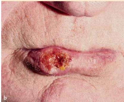
b Spinaliom mit Ulzeration an der Unterlippe rechts.