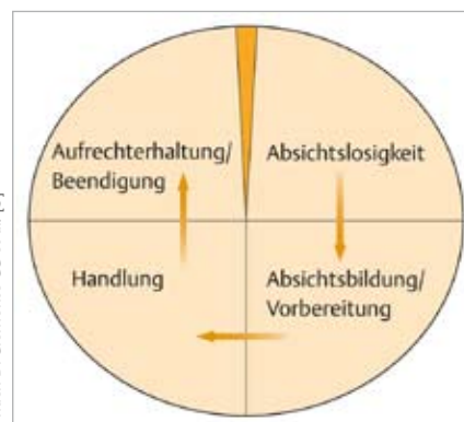
Abb. 1 Transtheoretisches Modell, adaptiert für den Kontext der neurologischen Rehabilitation (DiClemente et al. 1991): Die Patienten durchlaufen die Stadien sequenziell, beginnend im Stadium der Absichtslosigkeit. Die Geschwindigkeit der Veränderung kann individuell stark variieren. Zum Teil werden die ersten zwei Stadien bereits während der Akutbehandlung durchlaufen. Rückwärtsentwicklungen in ein Vorstadium kommen ebenfalls vor.

▪ Stadium der Absichtslosigkeit („Precontemplation“): In der ersten Woche des Aufenthaltes fühlte sich Frau A. ihrer Störung hilflos ausgeliefert. Sie hatte nicht die Gewissheit, dass sie durch Mitwirkung in der Rehabilitation ihre Situ-