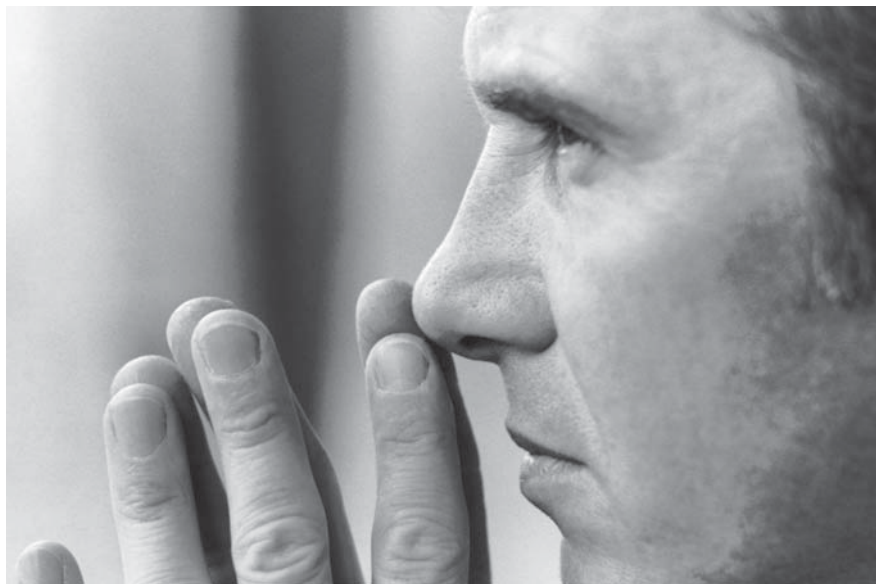
Abb. 1 Ist ein Heilpraktiker entspannt, erweitert sich dadurch seine Wahrnehmung. In diesem Zustand der gesteigerten Intuition erkennt er besser, was sein Patient braucht.

Ein Teil dieser subjektiven Wahrnehmung ist die sog. verfeinerte Wahrnehmung oder auch Intuition genannt. Der Heilpraktiker nutzt dabei den subjektiven Eindruck, den er von einem Patienten bekommt, während er mit ihm spricht oder ihn behandelt, für die Therapie.