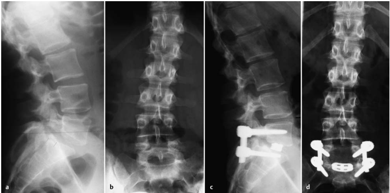
Abb. 5 a bis d 24-jährige Frau mit symptomatischer Spondylolyse und Spondylolisthese Meyerding Typ II (sensibles L5-Syndrom bds. und chronischer belastungsabhängiger Lumbalgie, Skoliose) (a, b). Postoperatives radiologisches Ergebnis nach Fusionsoperation mit Reposition in TLIF-Technik (c, d).

den. Eine generelle Empfehlung hinsichtlich des „optimalen“ Operationsverfahrens existiert derzeit nicht [6].