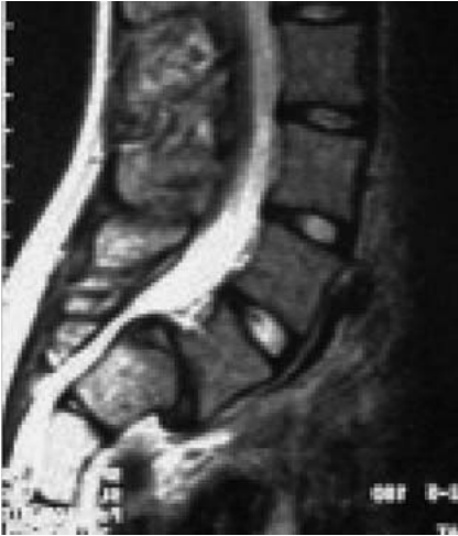
Abb. 1 Sagittales MRT (T2) eines 8-jährigen Mädchens. Isthmische Spondylolisthese (Meyering Grad I) bei Spondylolyse mit domförmigem Sakrum und trapezförmigem 5. Lendenwirbelkörper.

erworbene Formen der Spondylolyse unterscheidet.