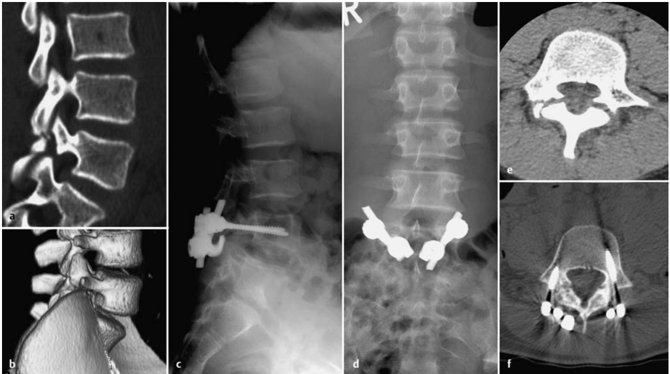
Abb. 3 a bis f 13-jähriger Knabe mit symptomatischer Spondylolyse (a, b). Beschwerdefreiheit nach Pars-Infiltration. Rekonstruktion der Pars interarticularis mit Pedikelschrauben und Laminahacken (c, d). Ausheilung des Pars-Defekts nach 9 Monaten (Vergleich von e und f) [4].

In Zweifelsfällen ist auch eine Szintigrafie oder SPECT (single photon emission computer tomography) sinnvoll, da sie die Bestimmung des Alters der Spondylolyse erlaubt. Dies ist vor allen Dingen für rekonstruktive Eingriffe von Bedeutung.