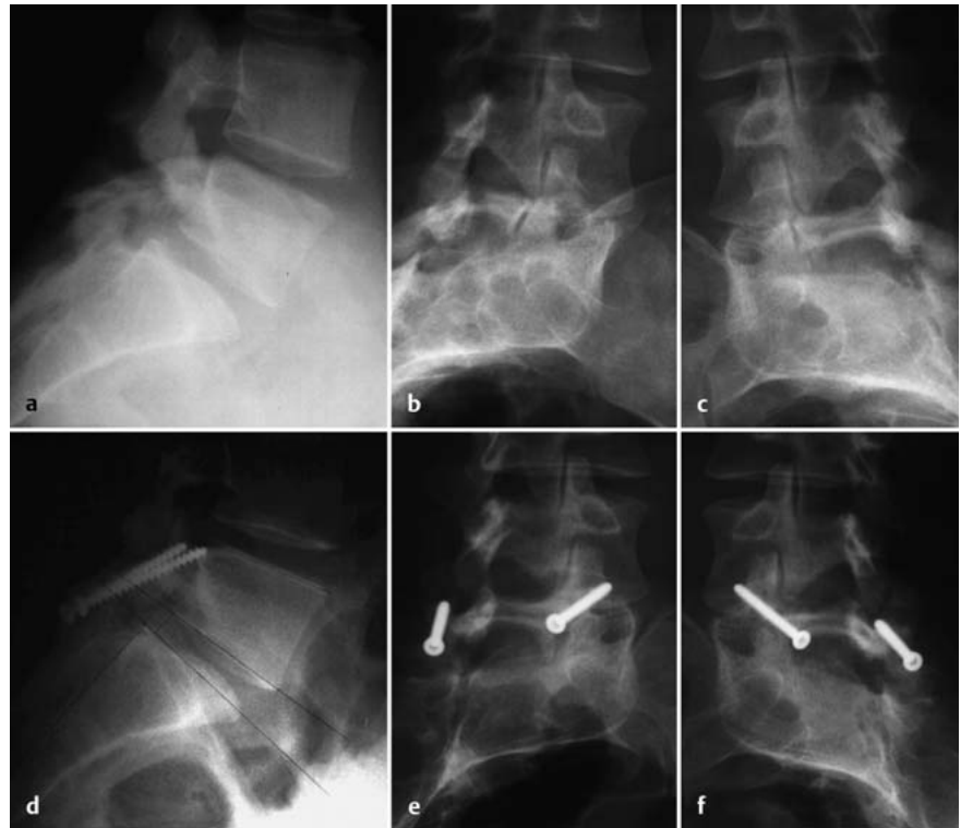
Abb. 2 a bis f 15-jähriger Knabe mit symptomatischer Spondylolyse: (a) Röntgenologische Darstellung des Hundehalsbands auf den Schrägaufnahmen (b, c). Beschwerdefreiheit nach Pars-Infiltration. Rekonstruktion der Pars interarticularis nach Buck (d, e, f) [1].

Eine neurologische Ausfallsymptomatik ist meist bei fortgeschrittener Spondylolyse mit Spondylolisthese anzutreffen. Das Wirbelgleiten kann dabei zu einer zentralen Spinalstenose führen, die eine Cauda-equina-Symptomatik mit Blasen- und Mastdarmschwäche sowie Hüftlendenstrecksteife durch Spasmus der ischiokorallen Muskulatur zur Folge haben kann. Die Ischialgie, die regelhaft die Nervenwurzel L5 und seltener auch die Nervenwurzel S1 betrifft, kann durch eine subpedikuläre Einengung durch fibroartilaginäres Gewebe im Parsbereich, durch eine foraminale Stenose bei neuroforaminaler Kompression oder in der Folge eines „Far-out-Syndroms“ durch Kompression des Nervs im Bereich des