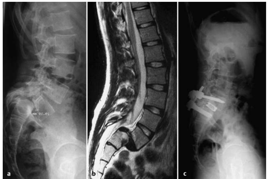
Abb. 4 a bis c 17-jähriges Mädchen mit symptomatischer Spondylolyse und Spondylolisthese Meyerding Typ IV (sensibles L5-Syndrom beidseits) (a, b). Postoperatives radiologisches Ausheilungsergebnis nach Fusionsoperation mit Reposition in PLIF-Technik (c).

Symptomatische Patienten, bei denen eine Spondylolyse nebenbefundlich diagnostiziert wird, fallen häufig in die Kategorie des sog. „unspezifischen Rückenschmerzes“ und bedürfen keiner speziellen Therapiemaßnahmen. Nur der kleine Prozentsatz symptomatischer Patienten mit „spezifischem Rückenschmerz“ bedarf einer speziellen konservativen Therapie.