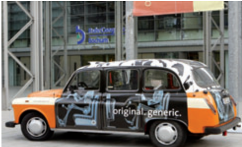
Abb. 2 Eingang zum Ruhrkongress Bochum

Der Nachmittag war der „ganz normalen“ Einstelltechnik in der Projektionsradiografie gewidmet: Einstelltechniken der Wirbelsäule und des Schultergelenkes auch im Hinblick auf orthopädische Indikationen. Bei diesen Themen ist nach wie vor großes Interesse zu verzeichnen. Abschließend wurde die Arbeit der Ärztlichen Stelle Westfalen Lippe vorgestellt und die neue QM-Richtlinie „Radiologie“.