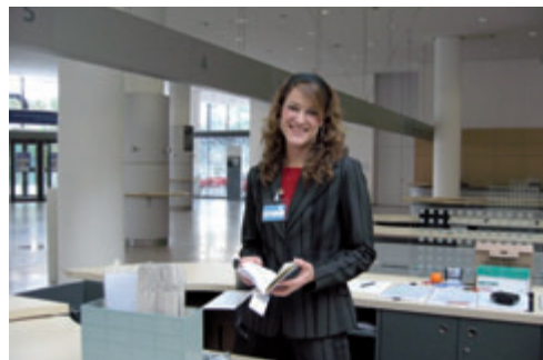
Abb. 4 Herzlich willkommen auf dem Lebkuchenkongress: Stand der VMTB im Nürnberger Messezentrum

Auch 2009 gibt es wieder Änderungen. Die Bayerische Landesärztekammer hat beschlossen, dass der Ärztekongress in dieser Form nicht mehr statt finden wird. Dies bedeutet für den 39. Fortbildungskurs für medizinisches Assistenzpersonal wahrscheinlich einen Umzug in ein anderes Hörsaalgebäude – der traditionelle Termin am 2. Advent und Nürnberg mit Lebkuchen und Christkindelsmarkt können bereits jetzt in den Terminplaner 2009 eingetragen werden. Die Planung ist in vollem Gange, so dass ein attraktives Programm mit aktuellen Themen, praktischen Übungen und der Möglichkeit, zur Auffrischung der Fachkunde auch dieses Jahr angeboten wird.