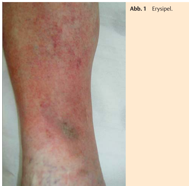
Abb. 1 Erysipel.

Das Erysipel gehört zu den häufigsten Formen einer tiefer reichenden Infektion der Haut. Zu den Besonderheiten dieser Erkrankung zählt, dass die Zeichen der lokalen Entzündung eng