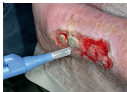
Abb. 2 An dem kaudalen Anteil des Ulcus cruris wurden bereits mittels niederfrequentem Leistungultraschall Nekrosen und Fibrin abgetragen.

aus. Über die Spülflüssigkeit, die primär der Kopplung des Ultraschalls dient und zentral durch das Handstück fließt, können Zusätze in die Wunden eingebracht werden. Zudem befindet sich in dem Handstück eine Absaugvorrichtung, die entstehende Aerosole zu einem großen Teil aufsaugen soll um eine Kontamination der Umgebung zu verhindern. Bei dem Ultraschall-Dissektor handelt es sich um ein kompaktes mobiles Gerät, das ausschließlich durch geschulte Ärzte angewendet werden sollte (Abb. 2).