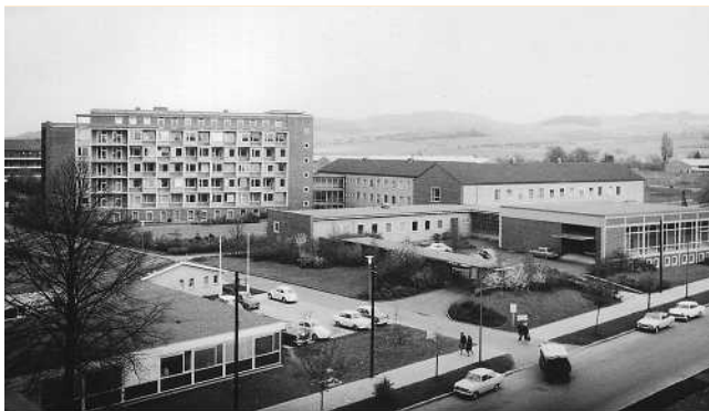
Abb. 4 Hinteransicht des 1959 fertiggestellten Neubaus der Universitäts-Hautklinik (Aufnahme etwa aus dem Jahr 1965): links das sechsstöckige Bettenhaus, rechts der Hörsaal als Flachbau mit großen Fenstern, dazwischen T-förmig der zweistöckige Behandlungstrakt und die ebenfalls zweistöckige Ambulanz. Der sich an die Ambulanz anschließende Flachbau in der Bildmitte beherbergte die Elektronenschleuder.

nen, die Zugangswege aber getrennt sind, sodass sich stationäre und ambulante Patienten nicht unbedingt begegnen müssen. So entstand eine Klinik mit einem Bettenrakt, einem Behandlungstrakt, zwei Polikliniken (getrennt für Männer und Frauen), dem Hörsaal und der Abteilung für die Elektronenschleuder. Alle Bereiche waren getrennt zugänglich. Das sechsstöckige Bettenhaus beherbergte 6 Stationen mit insgesamt 122 Betten. Das Gebäude wird noch heute von der Universitäts-Hautklinik genutzt. Im Laufe der Jahre wurden jedoch bauliche Veränderungen vorgenommen, die den sich ändernden Anforderungen Rechnung trugen. Die Bettenzahl wurde im Laufe der Jahre deutlich reduziert [5].