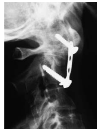
Abb. 3 Ventrale Plattenosteosynthese.

Diese frühzeitige Implantatlockerung löst Bestürzung im Behandlungsteam aus und man entschließt sich daher in