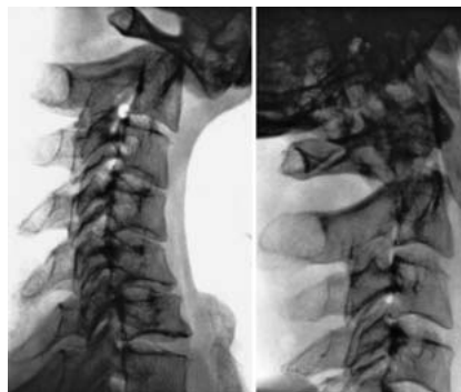
Abb. 1 Unfallbild.

Am Wochenende klagt der Patient über vermehrte Beschwerden bei der Visite – eine Röntgenkontrolle zeigt eine erneute Dislokation der Densfraktur, weshalb sich der diensthabende unfallchirurgische Oberarzt (der Autor) zu einer notfallmäßigen OP-Indikation veranlasst sieht. Die geplante Densverschraubung erfolgt daher im Wochenenddienst, intraoperativ ist die Visualisierung der Densspitze in beiden Ebenen lagerungsbedingt erschwert. Die Verschraubung mit 2 Kleinfragment-Spongiosaschrauben wird durchgeführt. Postoperativ wird der Patient in der Camp-Krawatte ruhig gestellt, er weist keine neurologischen Auffälligkeiten auf. Die postoperative Röntgenaufnahme zeigt zum einen, dass die Schraubenspitzen die Dens-