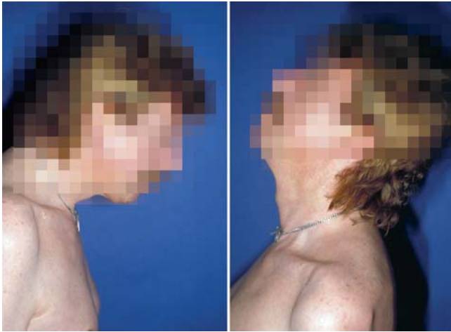
Abb. 5 Funktion Halswirbelsäule 1 Jahr postoperativ.

schraubt werden muss. In wöchentlichen Kontrollen kommt es unter Nachspannen der Halo-Fixateur-Konstruktion zu einer zeitgerechten knöchernen Durchbauung der Densfraktur. Daraufhin kann der Halo-Fixateur abgenommen werden.