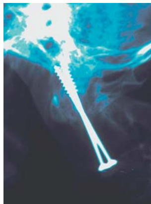
Abb. 2 Densverschraubung.

spitze überragen und zum anderen, dass die Schraubenbasis aus dem HWK2-Corpus distal ausgebrochen ist ( Abb. 2 ).