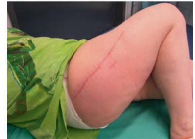
Abb. 5 Kontrolle nach 10 Wochen.