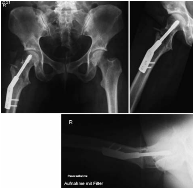
Abb. 2 Operatives Ergebnis.