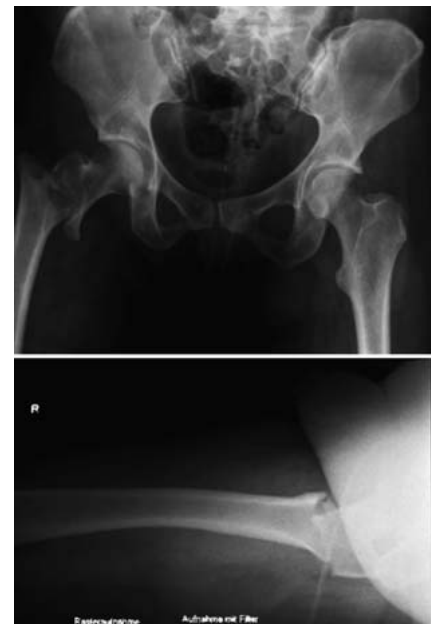
Abb. 1 Unfallaufnahmen.

Mittlerweile hatte der Eingriff bereits weit über 2 Stunden gedauert und die Inzision wies eine Länge von über 30 cm auf. Aufgrund des jungen Alters der Patientin sollte aber eine prothetische Versorgung vermieden werden, sodass der Klinikleiter den Eingriff selbst übernahm. Zunächst wurde die Trochanterregion nach erneuter Schnitterweiterung exploriert. Es zeigte sich eine komplette Fragmentierung des Trochanters und eine Verkipfung des Kopf-Hals-Fragments mit einer ausgedehnten medialen Dehiszenz. Mit großer Mühe konnte schließlich in Abduktion, Beugung und Außenrotation der rechten Hüfte unter Valgisierung des Kopf-Hals-Fragments eine Reposition mit medialer Abstützung erzielt und durch den Einsatz von 2 großen Wellerzangen passager gehalten werden. Allerdings musste dabei eine Rotation mit vermehrter Anteversion in Kauf genommen werden. Da aufgrund der zerstörten Nageleintrittsstelle die Implantation eines PFN-A nicht mehr möglich war, wurde das Konzept geändert und die Stabilisierung mit einer DHS angestrebt. Aufgrund der nun extraanatomischen Situation und der erheblichen Adipositas gestaltete sich die exakte Platzierung des Zieldrahts überaus mühsam. Schließlich konnte der Draht platziert werden und hierüber die Implantation einer DHS mit einem CCD-Winkel von 150 Grad erfolgen ( Abb. 2 ). Die intraoperative Bildgebung zeigte zwar eine grenzwertige Lage der DHS, aber ein akzeptables Repositionsergebnis mit medialer Abstützung, sodass auf eine weitere Ausdeh-