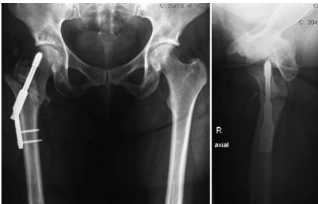
Abb. 4 Kontrolle nach 10 Wochen.

nehmende Durchbauung der Fraktur unter zunehmendem Belastungsaufbau (Abb. 4 und 5).