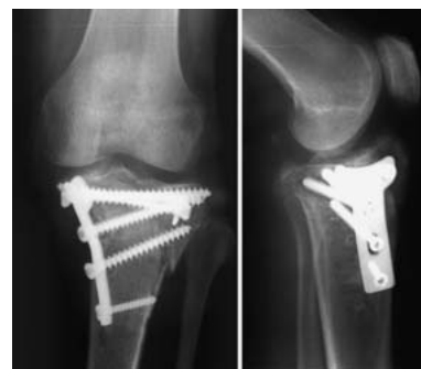
Abb. 2 Postoperative Röntgenbilder.