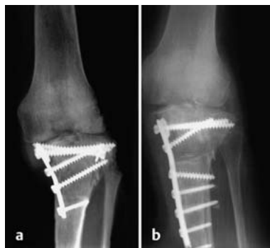
Abb. 3a und b a A.-p. Aufnahme 4 Wochen nach OP. b 2. Operation, postoperatives Bild.