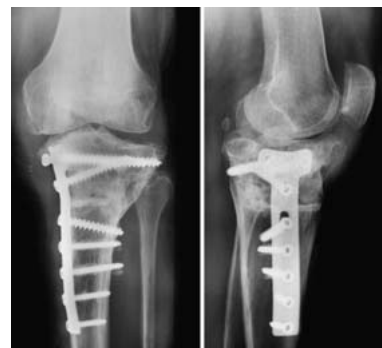
Abb. 4 Röntgen nach 8 Jahren.

durch die intraartikulär dislozierte Schraube zerstört.