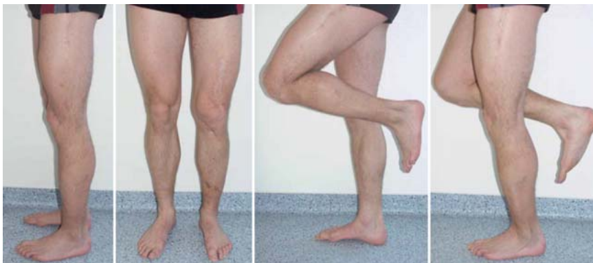
Abb. 4 Die Funktion des Beines ist wiederhergestellt.