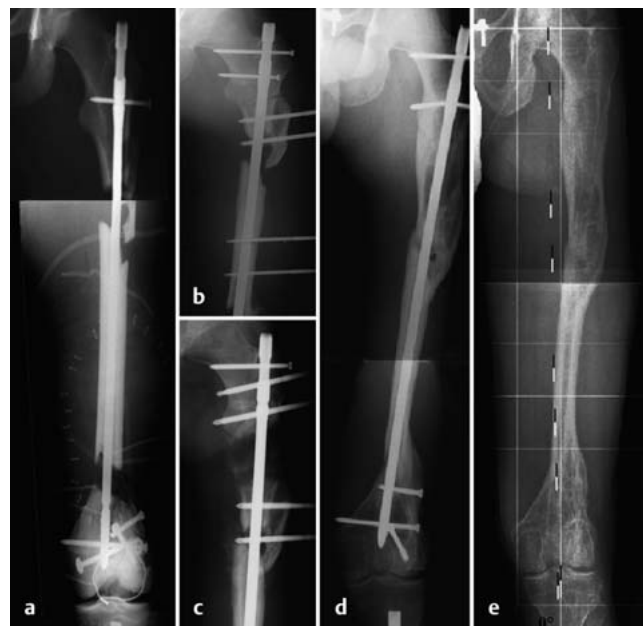
Abb. 2 a bis e a „Distanzhalter“ mit geschientem Transplantat. b Kortikotomie und Segmenttransport. c Kallusdistraction und Verlängerung. d Statische Verriegelung. e 10 Jahre später weitgehende Wiederherstellung.