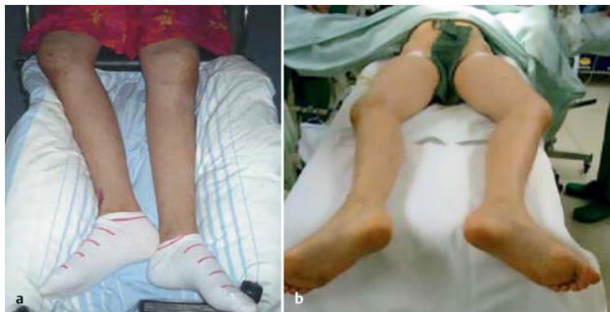
Abb. 2a und b Klinisches Bild vor Revision.