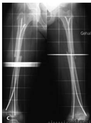
Abb. 2c Röntgen vor Revision.