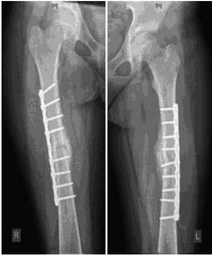
Abb. 3 Acht Wochen nach Revisions-Plattenosteosynthese.

kontrolle zeigte eine regelrechte Lage der Implantate und eine gute Einstellung der Frakturen. Klinisch zeigten sich regelrechte Achs- und Torsionsverhältnisse. Dies wurde durch die postoperative Röntgenkontrolle bestätigt.