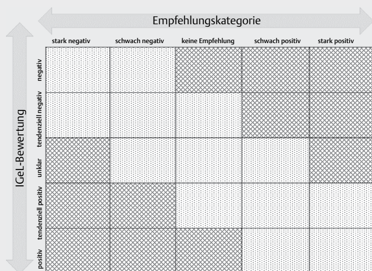
► Abb. 1 Empfehlungskategorien und IGeL-Bewertungen; Punkte = „(nahezu) Übereinstimmung“ bei 0 bis 1 Stufen Unterschied; Linien = „Abweichung“ bei 2 oder mehr Stufen Unterschied.

Zur Bewertung der methodischen Qualität der eingeschlossenen LL wurde das Appraisal of Guidelines for Research & Evaluation (AGREE) II-Instrument eingesetzt [12]. Die Anwendung des Instrumentes beschränkte sich auf die Domänen 3 (Genauigkeit der LL-Entwicklung) und Domäne 6 (redaktionelle Unabhängigkeit). Beide Domänen können als besonders relevant für die Vertrauenswür-