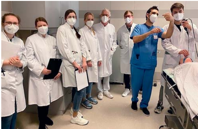
► Abb. 4 Die Studierenden bei der „Hands-on“-Bronchoskopie.