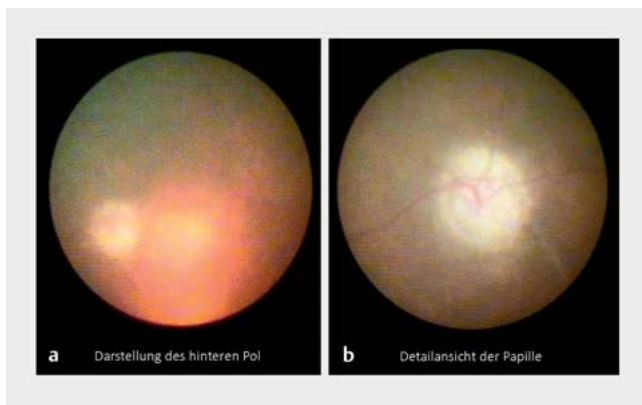
► Abb. 2 Fall 1: Darstellung des hinteren Pols (a) und Detailansicht der Papille (b) eines rechten Auges. Die Papille stellt sich blass und fortgeschritten exkaviert dar. Die Untersuchung mithilfe eines Mikroendoskops unterstützte die klinische Abschätzung des Visuspotenzials des Auges. Aufgrund der infausten Prognose wurde von der Implantation einer OOKP abgesehen.

OOKP: Osteo-Odonto-Keratoprothese; TKpro: Tibia-Keratoprothese; RPM: retroprothetische Membran; bds.: beidseits; FZ: Fingerzählen; HBW: Handbewegung; LS: Lichtschein; GvHD: Graft-versus-Host-Erkrankung