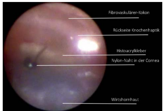
► Abb. 3 Fall 3: Darstellung des korrekten Prothesensitzes während der Implantation einer OOKPro. Das Endoskop wurde zwischen Wirtshornhaut (erscheint blau in der unteren Bildhälfte) und noch nicht fixierter OOKPro und chirurgisch eröffneter Mundschleimhaut geführt (s. Schema ► Abb. 1 b ). Die Zylinderoptik ist endoskopisch nicht sichtbar und somit vollständig und korrekt in die Wirtshornhaut eingelassen. Im Vordergrund (schwarz) sind Nylon-Nähte sichtbar (Beschriftung zur besseren Übersichtlichkeit eingefügt).