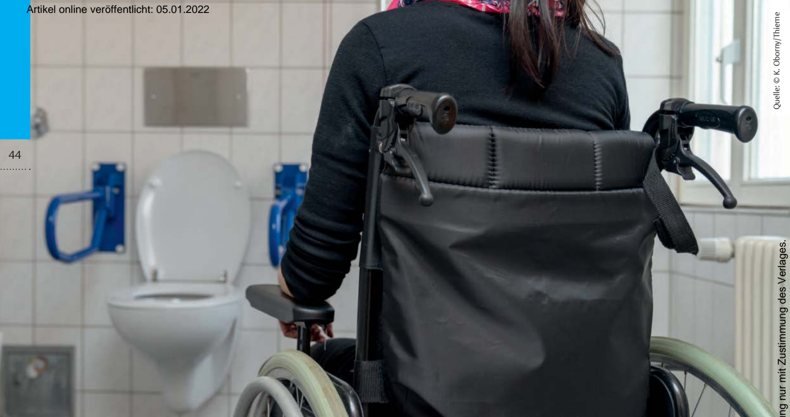
Sanitäranlagen mit Griffen und ausreichendem Platz für Rollstühle gehören zum A und O der Barrierefreiheit.