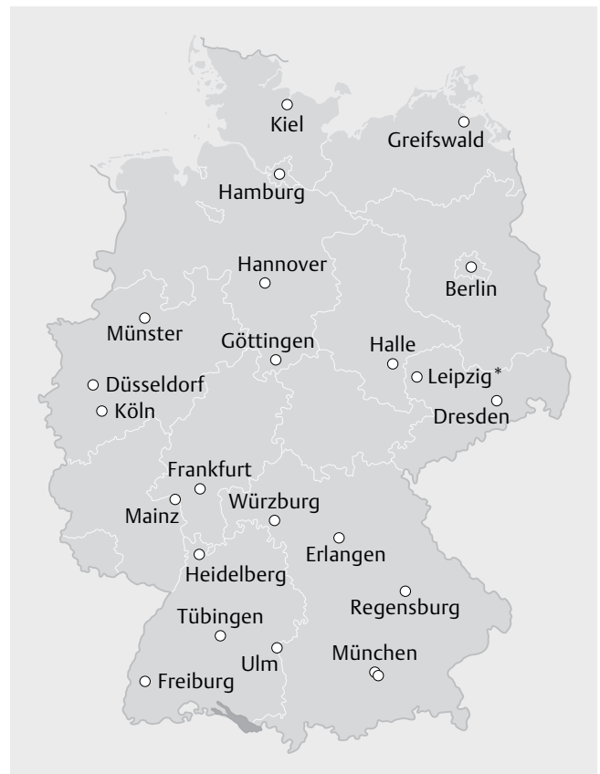
► Abb. 1 Universitäre Standorte des Deutschen Konsortiums Familiärer Brust- und Eierstockkrebs (* zusätzlich Standort der zentralen Datenbank).

Bis April 2019 wurde die wissenschaftliche Dokumentation von der Deutschen Krebshilfe gefördert. Im Jahr 2016 initiierte das Bundesministerium für Bildung und Forschung (BMBF) ein Förderprogramm zum Aufbau modellhafter Register in der Versorgungsforschung. Das DK-FBREK entwickelte daraufhin im Rahmen einer 9-monatigen Konzeptentwicklungsphase ein detailliertes Konzept zum Aufbau eines neuen patientenorientierten Registers für erblichen Brust- und Eierstockkrebs („HerediCaRe“, Hereditary Cancer Registry), welches seit