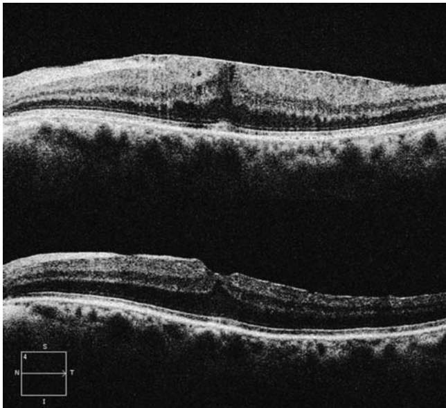
► Abb. 1 Präoperative Mikrozysten (oberes Bild) haben das Potenzial, sich nach der Operation zurückzubilden (unteres Bild).