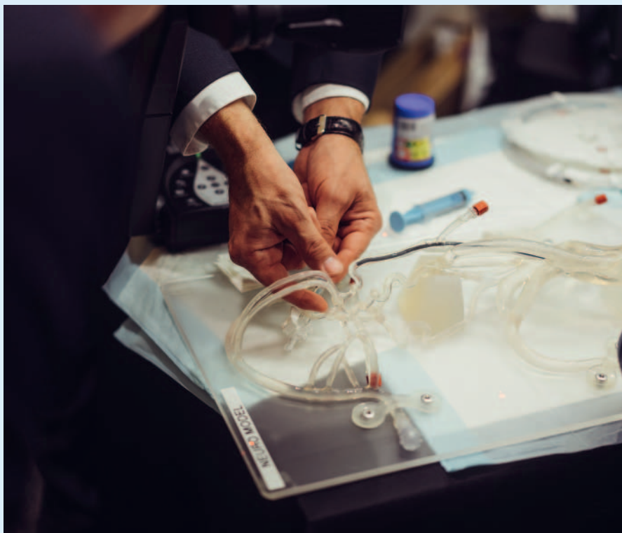
Echte Materialien anfassen, ausprobieren, mit Experten/Expertinnen diskutieren – ohne Einflussnahme der Industrie. (copyright: Christian Maegerlein).