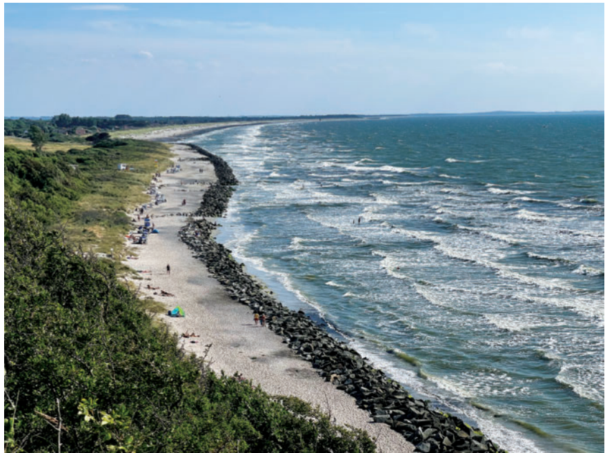
► Abb. 1 „Alles außer Palmen“, titelte vor einigen Jahren schon die Bild -Zeitung über den Strand der Ostseeinsel Hiddensee, an dem sich schon vor 100 Jahren Künstler, Schauspieler, Wissenschaftler, Schriftsteller und einige Esoteriker erholten und vor allem auch trafen, nachdem vor etwa 100 bis 120 Jahren die Infrastruktur in Form einiger kleinerer Hotels geschaffen worden war.

Im Gegensatz zur reichhaltigen wissenschaftlichen Literatur über die positiven gesundheitlichen Auswirkungen vom „Grünen“ (Green Space) gibt es nur wenige belastbare wissenschaftliche Quellen zu den