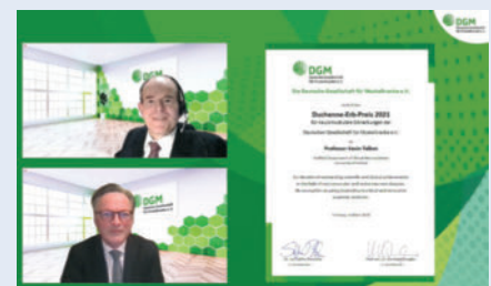
► Duchenne-Erb-Preis International