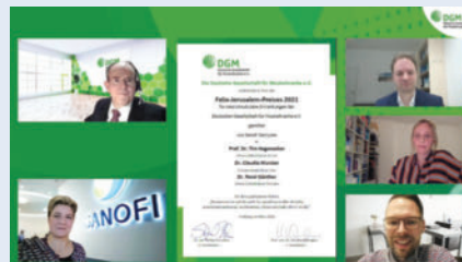
► 1. Preis des Felix-Jerusalem-Preises

Der Felix-Jerusalem-Preis für neuromuskuläre Erkrankungen der DGM wird von dem