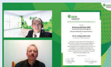
► Duchenne-Erb-Preis National