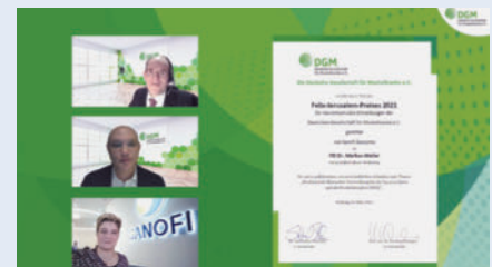
► 2. Preis des Felix-Jerusalem-Preises