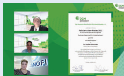
► 3. Preis des Felix-Jerusalem-Preises